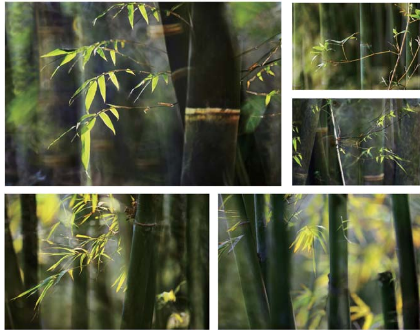
■ 陸天石先生攝影作品《竹》

其實陸天石玩攝影的時間只有十三年，這與很多攝影發燒友相比時間算比較短的。而他利用業餘時間，學習鑽研藝術攝影，在學習攝影的第二年，他就通過了英國皇家攝影協會會士考核。他是一個喜歡挑戰、勇於創新的人。接下來的幾年裏，他又參加了全球的國際沙龍比賽，潛心學習，取他人之長提升自己。陸天石先生是美國攝影學會五星攝影家，並榮獲美國攝影學會統計2008、2009、2010年沙龍“十杰”榮譽。