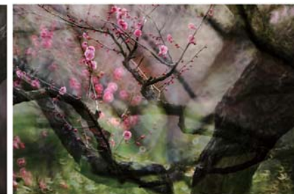
■ 陸天石先生攝影作品《梅》

他喜歡通過鏡頭去創作，走近一朵花，發現一處美景，或者是融入一群人，生活中處處都是他的素材。他有自己的攝影理念，不拘泥於傳統，創作出多個系列的“畫意”攝影作品。他淡泊名利，恣意享受攝影的快樂。他就是國際影藝聯盟(FIAP) 攝影藝術大師——陸天石先生。