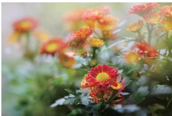
■ 陸天石先生攝影作品《菊》